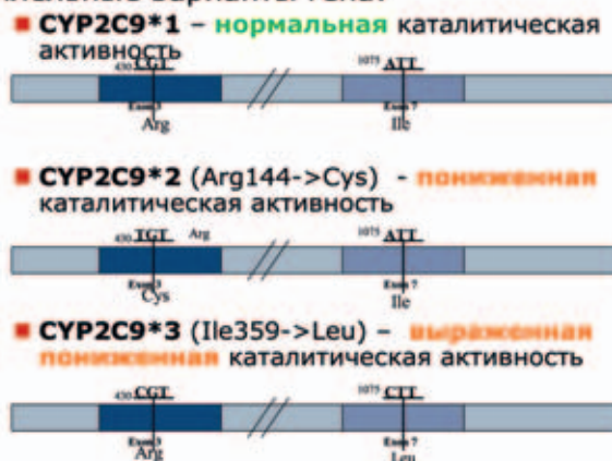
Схема 3. Полиморфизм гена CYP2C9: нормальная каталитическая активность фермента соответствует варианту CYP2C9*1 (верхняя часть схемы), наличие мутаций, заключающихся в замене аргинина на цистеин в 144 позиции или изолейцина на лейцин в 359 позиции, приводит к существенному снижению каталитической активности фермента (варианты CYP2C9*2 и CYP2C9*3)

тромбозов, тромбоэмболий, снижения риска инфаркта. Интенсивность воздействия антикоагулянта определяется индивидуальной чувствительностью, обусловленной генетическим полиморфизмом цитохрома P-450 (изоформа CYP2C9) (схема 3) [5].