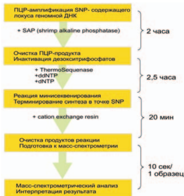
Схема 1. Основные этапы анализа точечных полиморфизмов: использование микропланшетного формата и средств автоматизации обуславливает высокую скорость постановки теста (384 образца за 5 часов)

катион-обменной смолы. Данный этап необходим для избавления от «шумов», которые появляются в масс-спектре образцов из-за наличия ионов K^+ , Na^+ и Ca^{++} в буферном растворе;